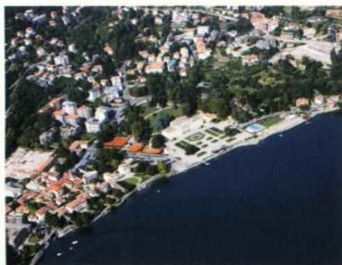
Como/Italia, nuovo base Yachtcharter Sneek.

Il Lago di Como è un'area dove gli amanti della natura si troveranno a loro agio!