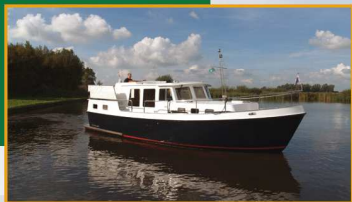
Rückblick Saison 2010